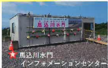
馬込川水門 インフォメーションセンター