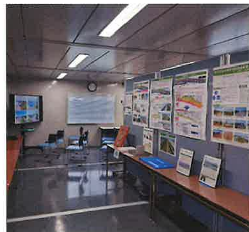
インフォメーションセンター内