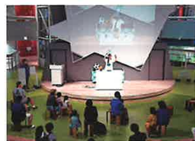
サイエンスショー